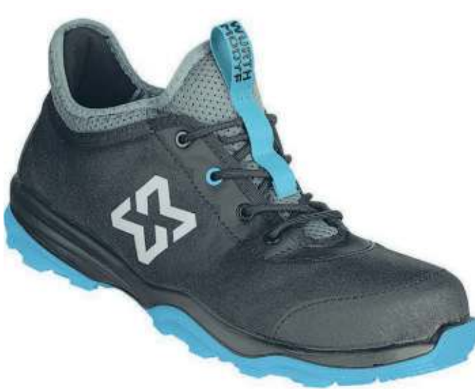
LA VARIANTE NERA E AZZURRA DI ECOFRESH

Un ultimo aspetto, non per questo meno importante, è quello della sicurezza: EcoFresh è la prima scarpa marchiata Würth Modyf che rispetta la nuova normativa sul puntale: essa sancisce che tra le dita e il puntale debba esserci un maggior spazio libero, proprio per aumentare il livello di sicurezza.