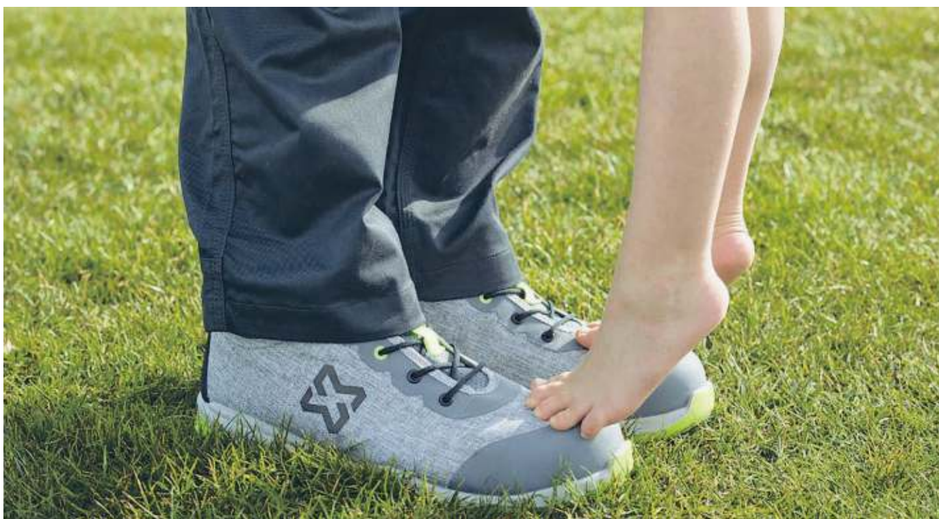
IL FUTURO IN UNA SCARPA ANTINFORTUNISTICA SICURA E LEGGERA

LA STORIA ▶ L'ABBIGLIAMENTO È CONTRADDISTINTO DALLA RICERCA NEI MATERIALI, NEL DESIGN E NEI DETTAGLI