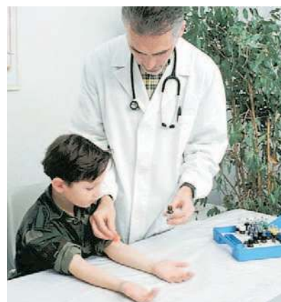
▲ I vaccini Presto potrebbero essere disponibili gli antinfluenzali spray da praticare fra i 2 e i 18 anni

Restano i ritardi: gli over 65 anni e le persone fragili devono richiederla al proprio medico di medicina generale. E sono ancora molti i medici che non le hanno ricevute. Ritardi che la Regione imputa «alla mancata fornitura di circa 500 mila dosi di vaccino Vaxigrip Tetra da parte della società Sanofi Pasteur che si è aggiudicata la gara per fornire 1,4 milioni di dosi». Al netto delle ultime consegne mancano all'appello 500 mila dosi. «Per questo – ha spiegato la Regione sull'onda delle lamentele – Sanofi è stata già diffidata da parte della Centrale acquisti regionale a consegnare tutto ciò che è stato contrattualizzato ed è stata attivata anche l'avvocatura regionale».