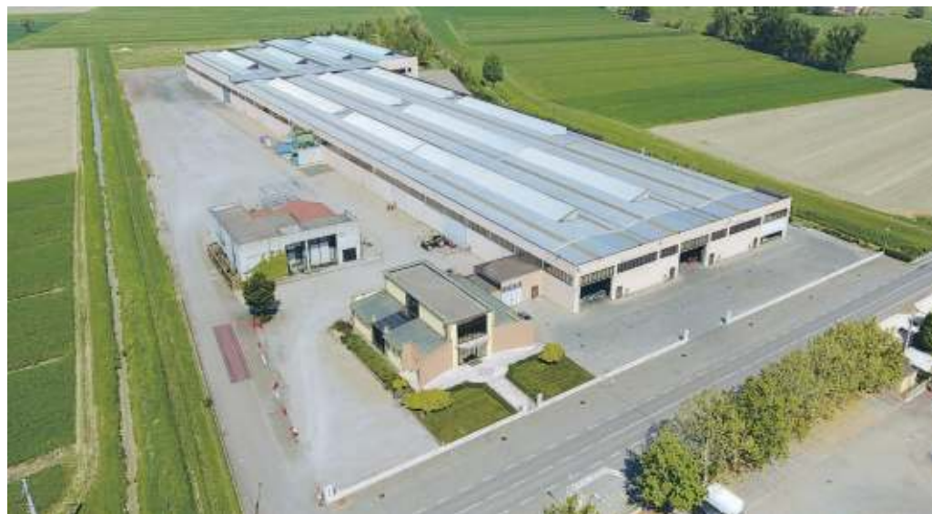
LO STABILIMENTO MAVERIN, DOVE AVVIENE LA PRODUZIONE

rappresenta una delle più importanti misure di sicurezza: le porte tagliafuoco hanno la delicata funzione di circoscrivere l'area, frazionare i rischi e creare aree sicure.