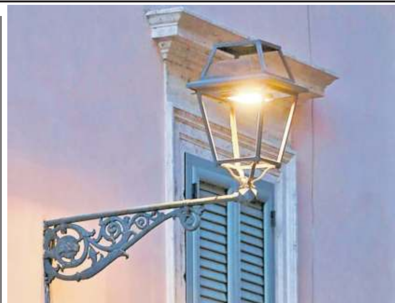
▲ I lampioni Le nuove lampade a led che hanno sostituito le tradizionali

approvato nel giugno del 2015 dalla giunta Marino e costato 48 milioni di euro: secondo l’Antitrust la sostituzione delle lampade in città con quelle al Led è stata fatta “indipendentemente dalle esigenze di efficientamento energetico del territorio (che possono variare anche notevolmente a seconda del tipo di illuminazione necessaria)”. Non so-