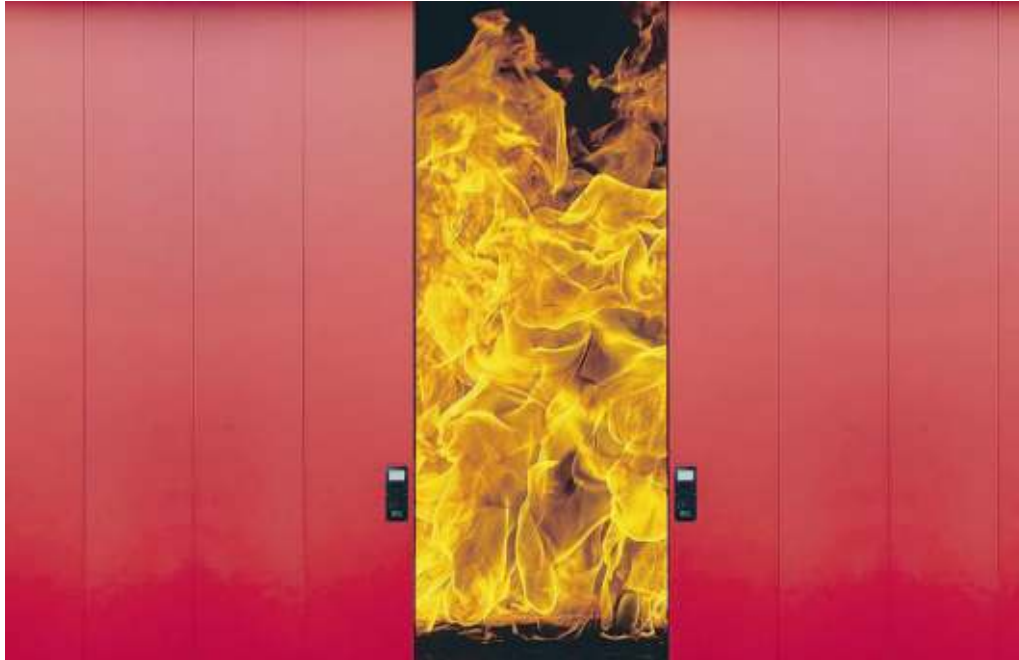
LE SOLUZIONI DELL'AZIENDA SONO RISORSE AFFIDABILI CONTRO IL RISCHIO INCENDIO

L'azienda studia e progetta le proprie linee di produzione e dispone di un'ampia gamma di prodotti