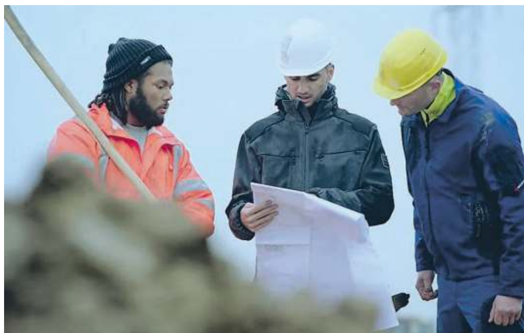
IL BRAND È NATO NEL 1997

Würth Modyf, che nel 2020 ha conquistato il prestigioso pre-