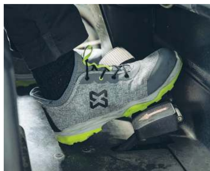
IL MODELLO ECOFRESH IN GRIGIO E VERDE